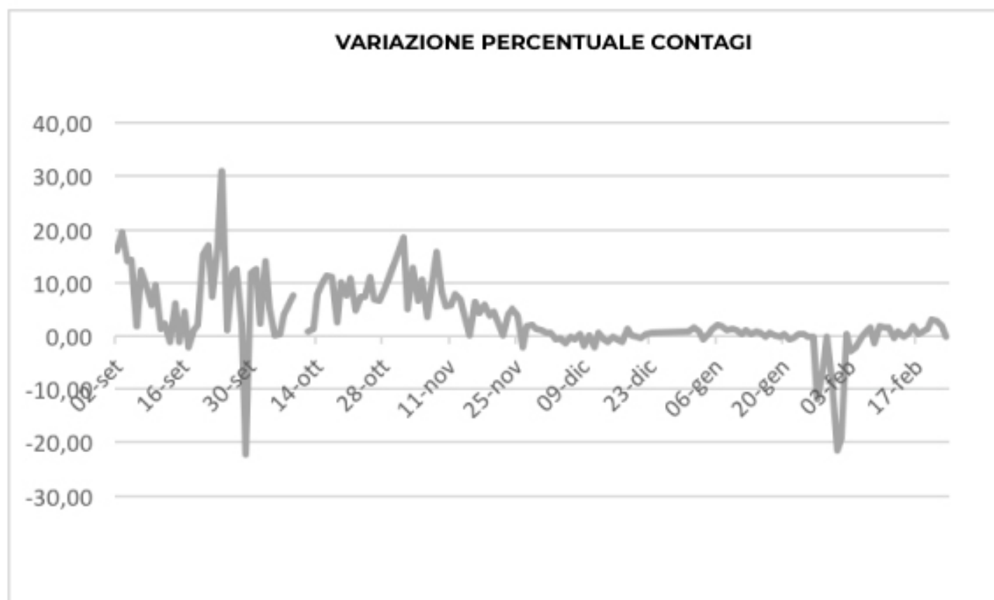
GRAFICO VARIATIONE PERCENTUALE CONTAGI